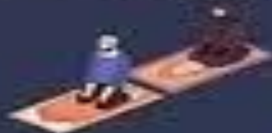
Suami & Istri