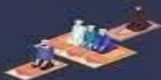
Ayah, Ibu & Anak laki-laki banyak