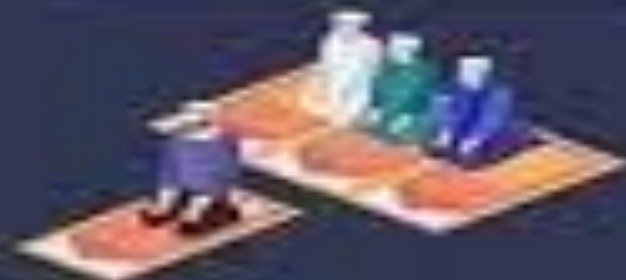
Jamaah laki-laki lebih banyak