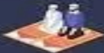
Ayah & Anak laki-laki