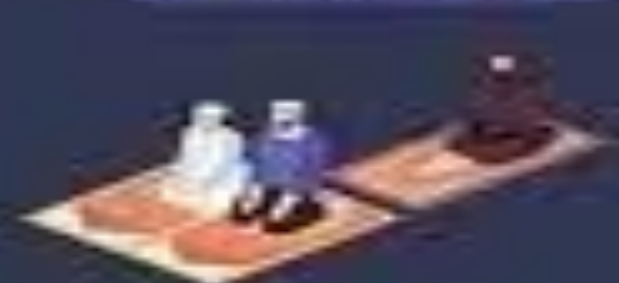
Ayah, Ibu & Anak laki-laki